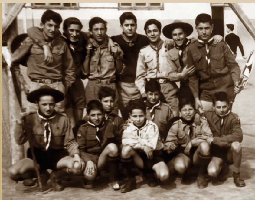
1957 - Gruppo giovani Scout nel cortile della parrocchia di Cristo Re